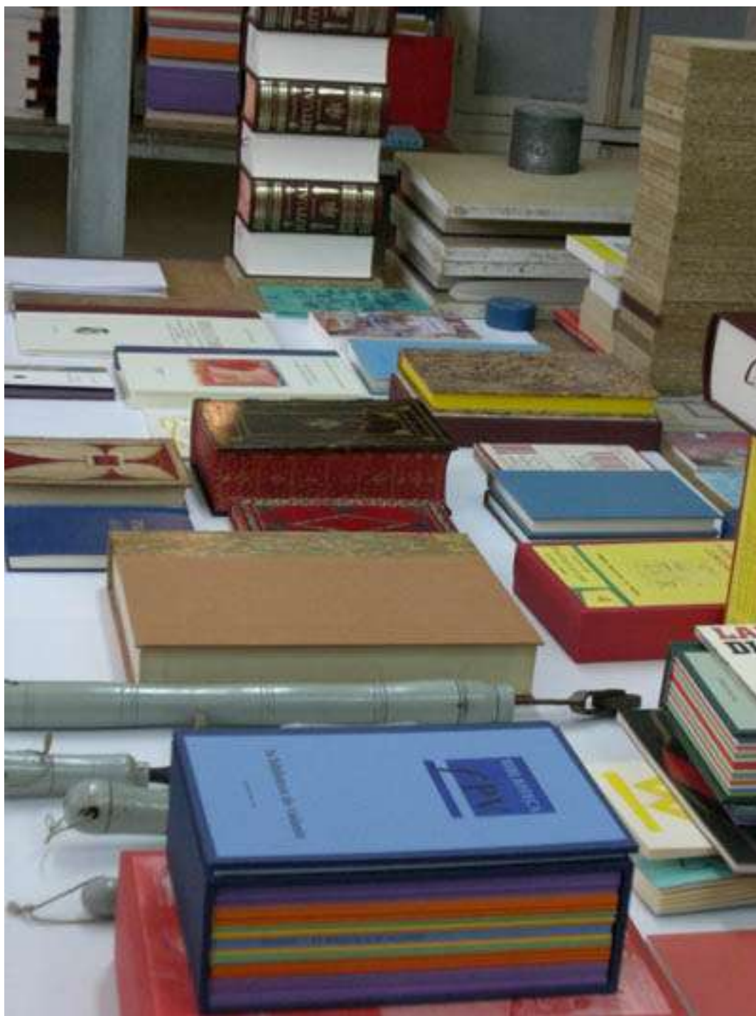
Ediciones de Corona del Sur. Una de las bibliotecas más importantes en poesía visual y experimental de nuestro país