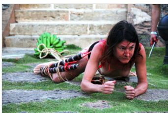
Fort San Felipe, 2013 Puerto Plata. República Dominicana.

¿De qué manera una condición o experiencia personal, como una enfermedad mental, interactúa con la estigmatización comercial y social del entorno?