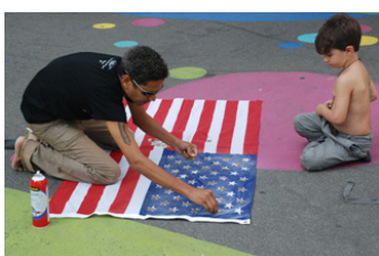
Supernova Festival, 2013 Rosslyn, Virginia.

Partiendo del episodio de la muerte del poeta Hernández, quiero hacer un funeral poético de un lingote de oro, ese oro histórico que tanto nos une y nos des-une.