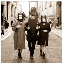
Museo de Arte Extemporáneo MAE

Miguel de todos los Migueles, de todos los vientos, de todos los pueblos, de todas las tierras, de todos los mundos.