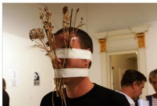
El hombre que quería ser poema, 2012. Centre de Lectura. Reus.

El ámbito en el que trabajo es la poesía experimental y, al igual que en la poesía visual y objetual, que también cultivo, en la acción poética todo es susceptible de convertirse en concepto, en símbolo o en palabra, en signo.