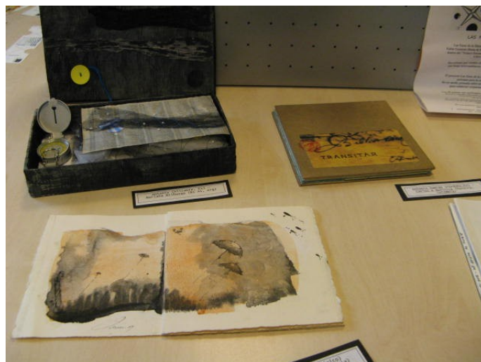
Exposición de libros de artista pertenecientes al proyecto de “Las Fases de la Distancia”