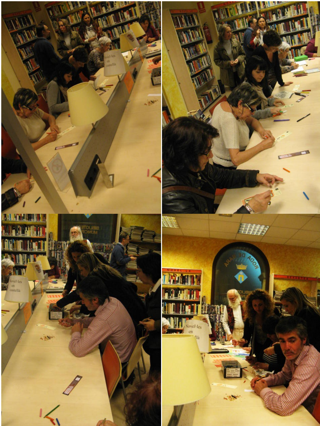
Taller de poesia visual sobre punto de libro. Hermanamiento simbólico entre Roda de Barà y Milán, donde será expuesta la muestra que volverá y se donará definitivamente a la Biblioteca De Roda de Bara